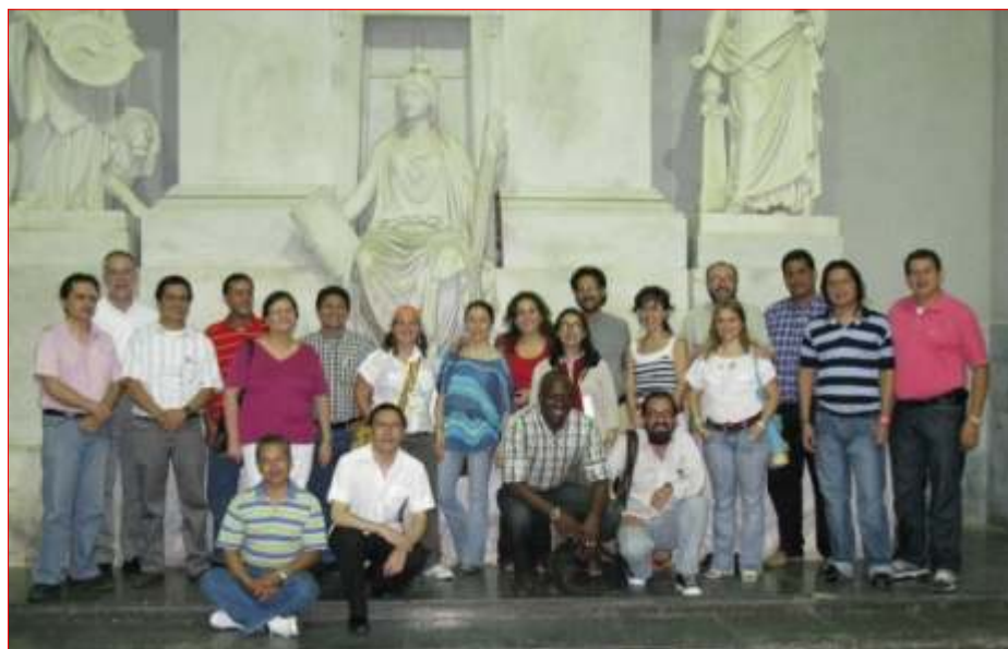
Directores de las emisoras que integran la RRUC reunidos en el VII Encuentro de la Red en Santa Marta.