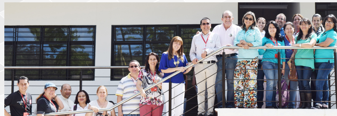
Las directivas de la UFPS y la Facultad de Ciencias Agrarias y del Ambiente inauguraron los salones y residencias estudiantiles ubicados en la Granja San Pablo, en el municipio de Chinácota.