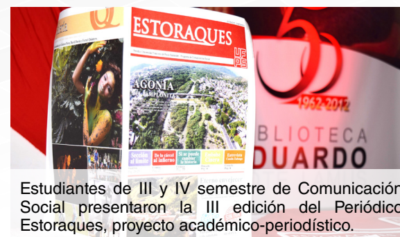
Estudiantes de III y IV semestre de Comunicación Social presentaron la III edición del Periódico Estoraques, proyecto académico-periodístico.