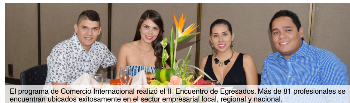
El programa de Comercio Internacional realizó el II Encuentro de Egresados. Más de 81 profesionales se encuentran ubicados exitosamente en el sector empresarial local, regional y nacional.