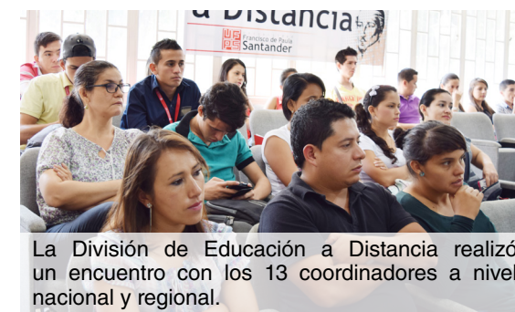
La División de Educación a Distancia realizó un encuentro con los 13 coordinadores a nivel nacional y regional.