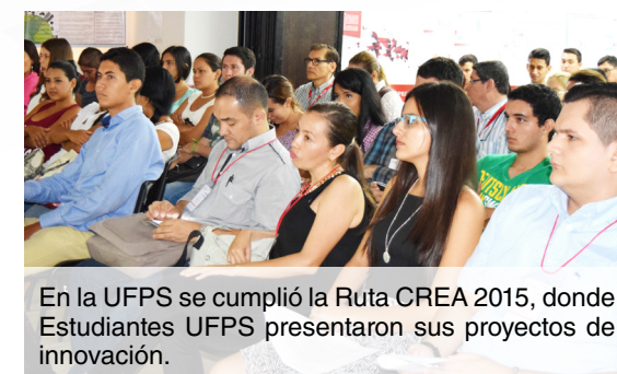
En la UFPS se cumplió la Ruta CREA 2015, donde Estudiantes UFPS presentaron sus proyectos de innovación.