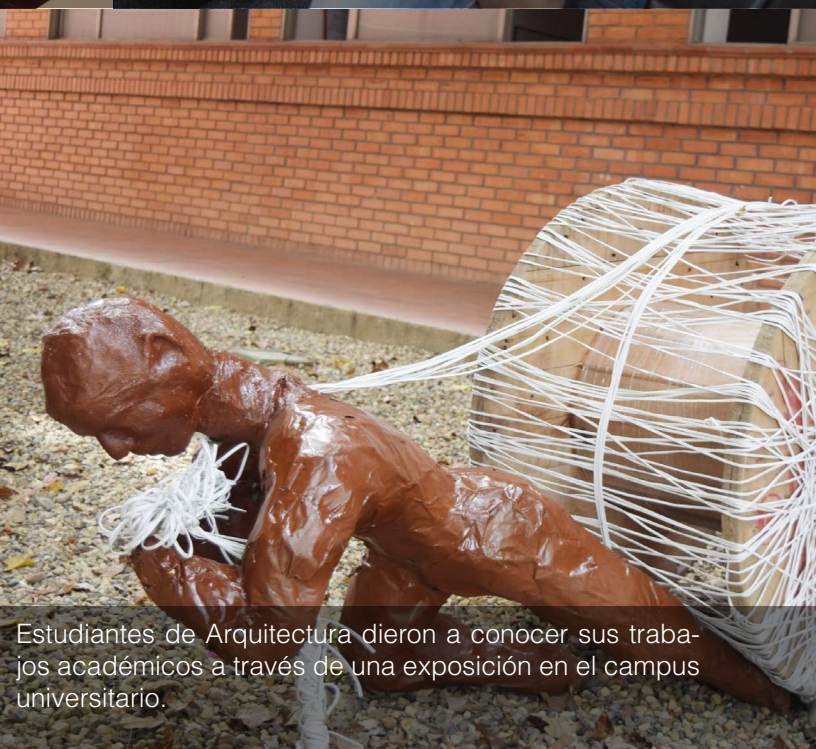
Estudiantes de Arquitectura dieron a conocer sus trabajos académicos a través de una exposición en el campus universitario.