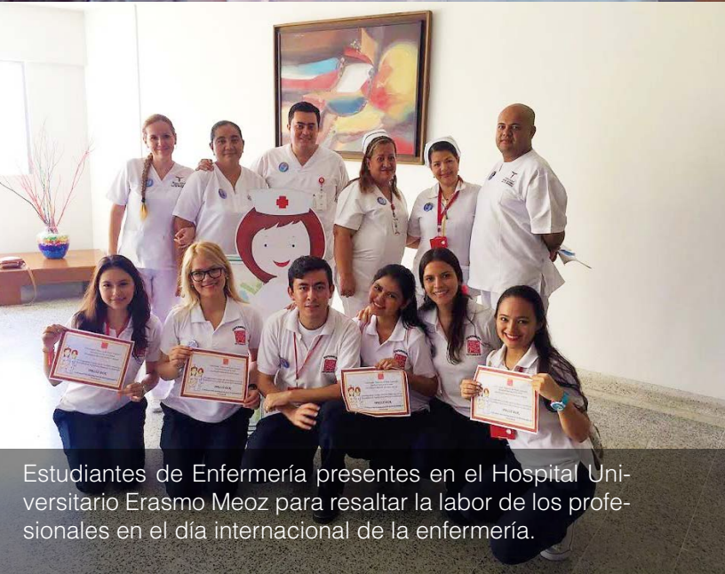
Estudiantes de Enfermería presentes en el Hospital Uni- versitario Erasmo Meoz para resaltar la labor de los profe- sionales en el día internacional de la enfermería.