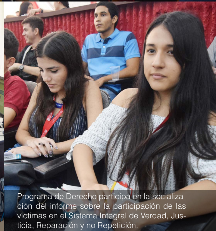
Programa de Derecho participa en la socialización del informe sobre la participación de las víctimas en el Sistema Integral de Verdad, Justicia, Reparación y no Repetición.