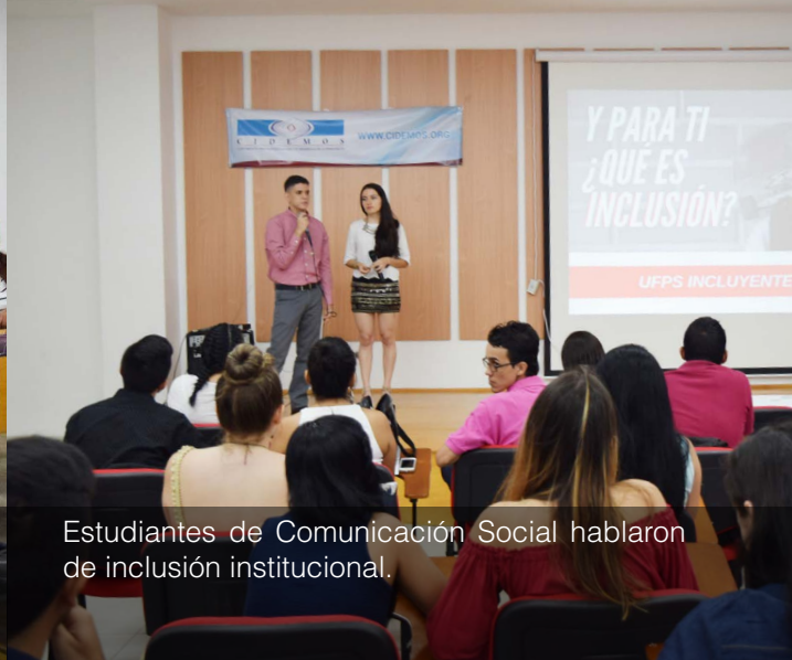
Estudiantes de Comunicación Social hablaron de inclusión institucional.