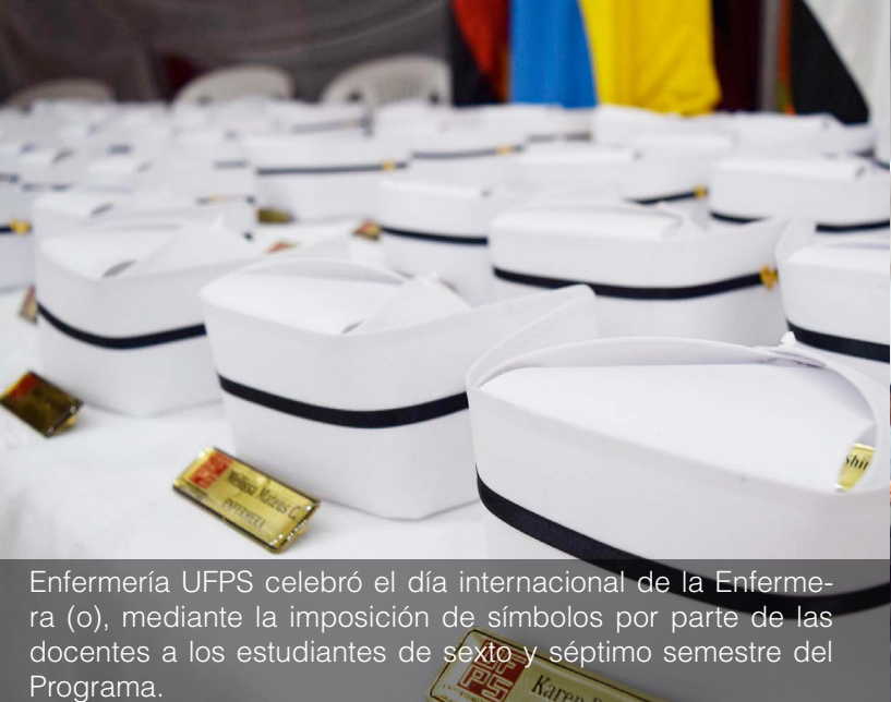
Enfermería UFPS celebró el día internacional de la Enferme- ra (o), mediante la imposición de símbolos por parte de las docentes a los estudiantes de sexto y séptimo semestre del Programa.