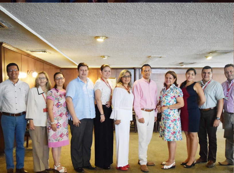
UFPS oficializa la intención de creación de un convenio con la Universidad Nacional Autónoma de México –UNAM–.