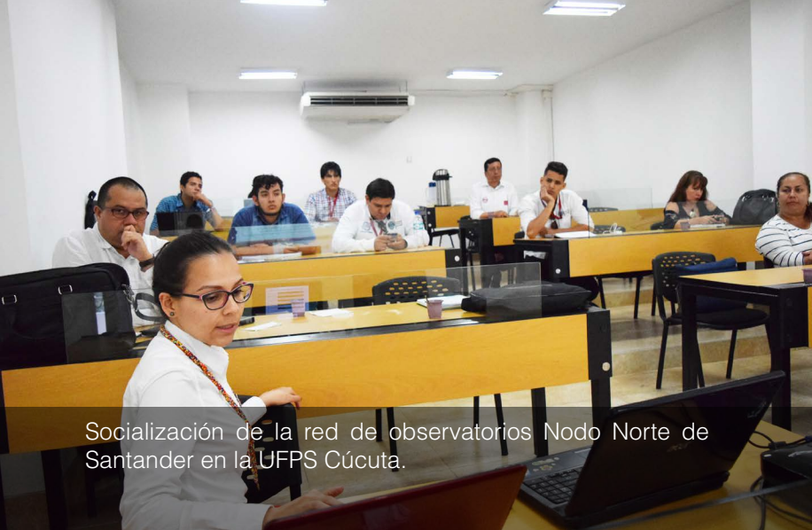
Socialización de la red de observatorios Nodo Norte de Santander en la UFPS Cúcuta.