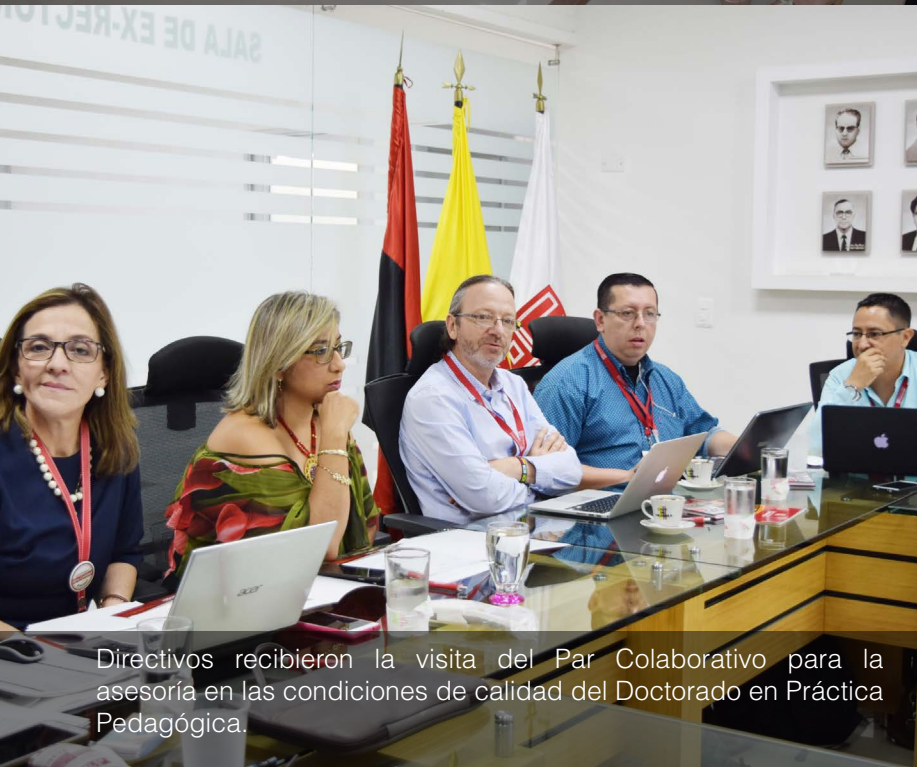
Directivos recibieron la visita del Par Colaborativo para la asesoría en las condiciones de calidad del Doctorado en Práctica Pedagógica.