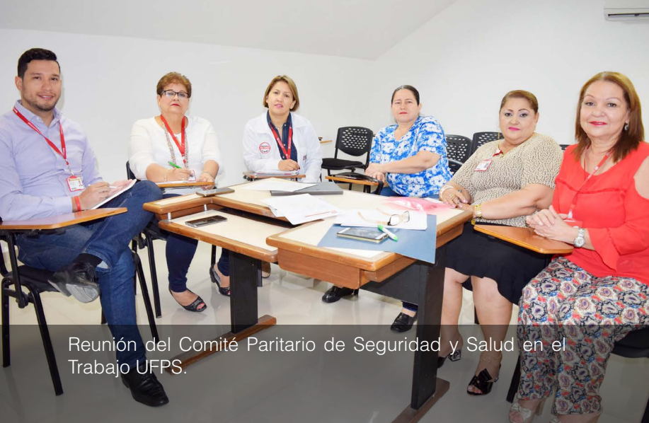
Reunión del Comité Paritario de Seguridad y Salud en el Trabajo UFPS.