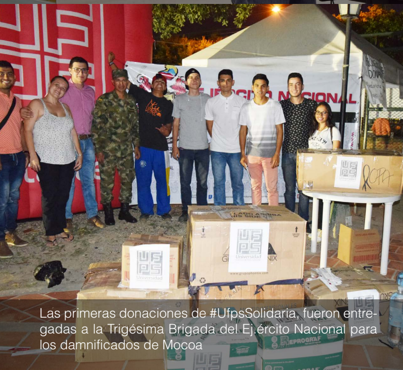
Las primeras donaciones de #UfpsSolidaria, fueron entregadas a la Trigésima Brigada del Ejército Nacional para los damnificados de Mocoa