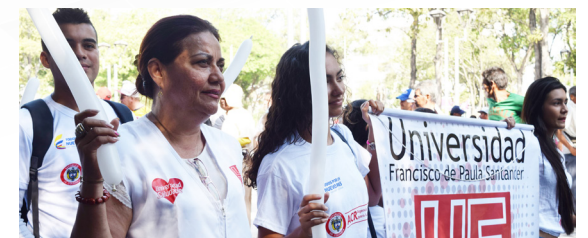
La UFPS se hizo presente en la marcha del Día Internacional contra la Utilización de los Niños en el Conflicto Armado, y el NO al reclutamiento de menores.