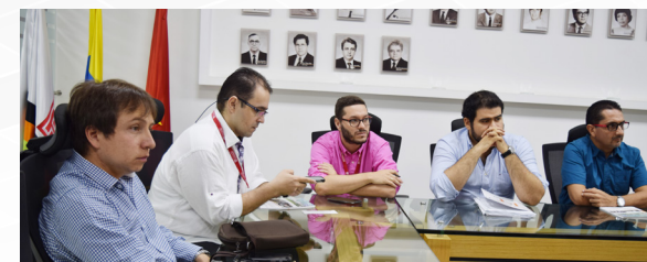
Directores de consultorios jurídicos de Norte de Santander recibieron asesoría en la UFPS sobre su rol en el posconflicto en alianza con el Departamento de Justicia de Estados Unidos.