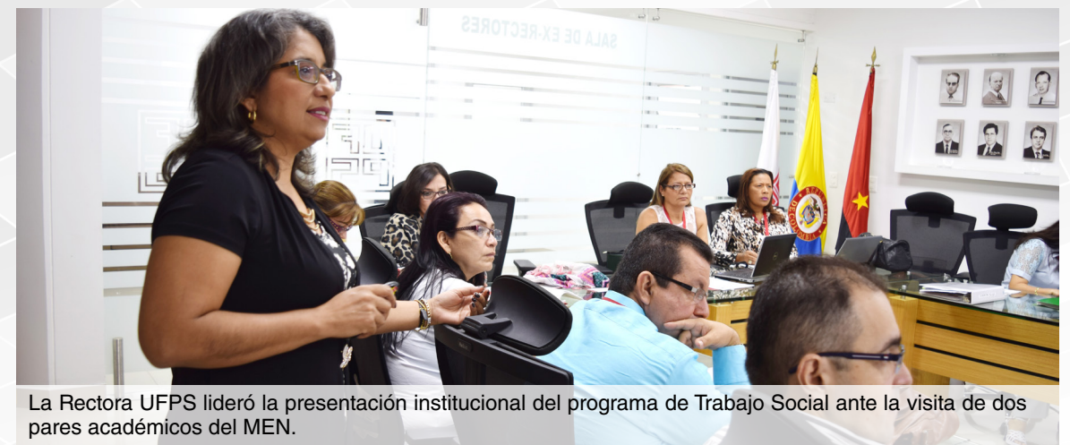
La Rectora UFPS lideró la presentación institucional del programa de Trabajo Social ante la visita de dos pares académicos del MEN.