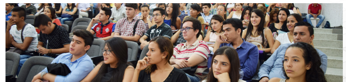
Programa de Derecho UFPS lideró Foro Regional: Reflexiones a la Reforma del Sistema Penal Acusatorio en Colombia