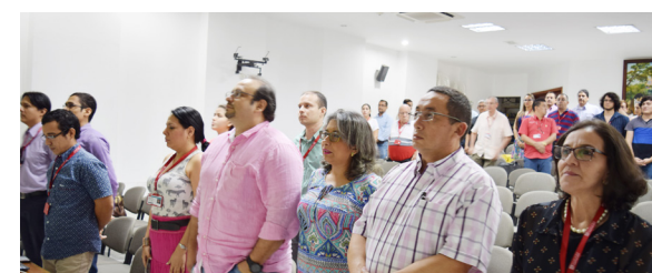
Directivas, docentes y estudiantes asistieron al lanzamiento de DIVISIST 2.0, la cual combina seguridad y diseño para el beneficio de los estudiantes.